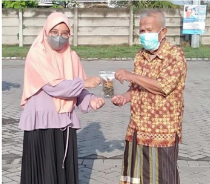
Gambar 3: Pemberian sampel jamu saintifik

dari 40% menjadi 95% seperti pada gambar 2. Berdasarkan banyaknya pertanyaan yang diutarakan saat acara seminar dan pelatihan menunjukkan antusiasme warga sangat tinggi terhadap kegiatan ini.