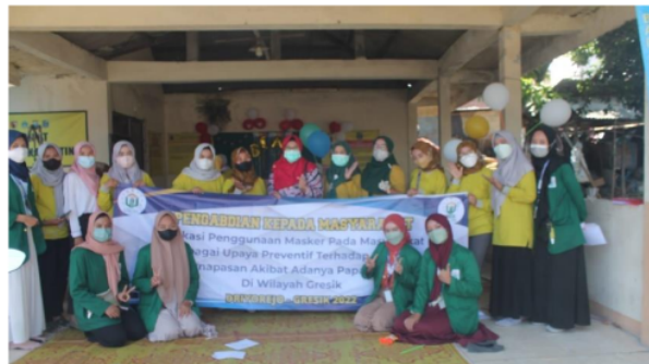
Gambar 1. Dosen, mahasiswa dan peserta penyuluhan dalam kegiatan pengabdian masyarakat di Dusun Pidodo Pos 4, Desa Sumput, Kec Driyorejo, Kabupaten Gresik

Driyorejo merupakan salah satu kawasan industri di wilayah Gresik. Aktivitas masyarakat di luar rumah disarankan untuk tetap menggunakan masker secara benar untuk mencegah paparan polusi udara kontak dengan tubuh, selain itu sebagai upaya pencegahan penularan Covid 19 masyarakat tetap disarankan menggunakan masker dan mematuhi protokol kesehatan. Berikut ini adalah dokumentasi kegiatan pengabdian masyarakat: