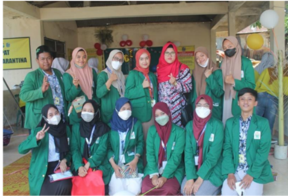
Gambar 2. Dosen dan Mahasiswa dalam kegiatan pengabdian masyarakat di Dusun Pidodo Pos 4, Desa Sumput, Kecamatan Driyorejo, Kabupaten Gresik