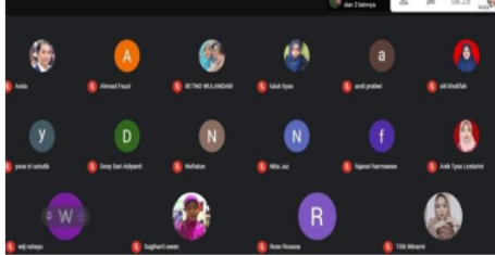
Gambar 2. Screenshot Gamet Yang Dilakukan Mahasiswa Kampus Mengajar 3 Dalam KBM Via Gmeet

Pemanfaatan aplikasi digital lain seperti WhatsApp sebagai media pembelajaran edukatif dalam program kampus mengajar ini ditunjukkan oleh Gambar 3. Whatsapp sebagai salah satu media sosial paling berpengaruh dan banyak digunakan oleh masyarakat di Indonesia. Para siswa di Indonesia pada era digital saat ini sudah meng 33 nakan gawai dalam aktivitas keseharian mereka baik di sekolah maupun di luar sekolah. Namun, sebagian besar pelajar menggunakan aplikasi media sosial, khususnya Whatsapp, hanya untuk bermedia sosial saja, padahal di dalam aplikasi tersebut, terdapat manfaat yang bisa meningkatkan kemampuan literasi digital.