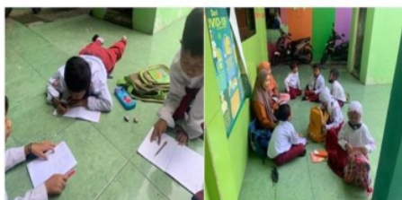
Gambar.3. Kegiatan Pembelajaran Luring Bersama Siswa dan Mahasiswa KM3

Dalam program kampus mengajar ini, mahasiswa membantu kelancaran proses pembelajaran tatap muka di setiap sesinya dengan mengisi kelas yang kosong. Terkait proses pembelajaran tatap muka bergilir, siswa dan guru seperti mulai terbiasa dengan prosesnya, dan antusiasme serta minat belajar siswa meningkat dibandingkan dengan pembelajaran jarak jauh (daring). Dokumentasi aktivitas mahasiswa, guru, dan siswa saat proses pembelajaran offline (tatap muka) secara bergilir ditunjukkan oleh Gambar 3.