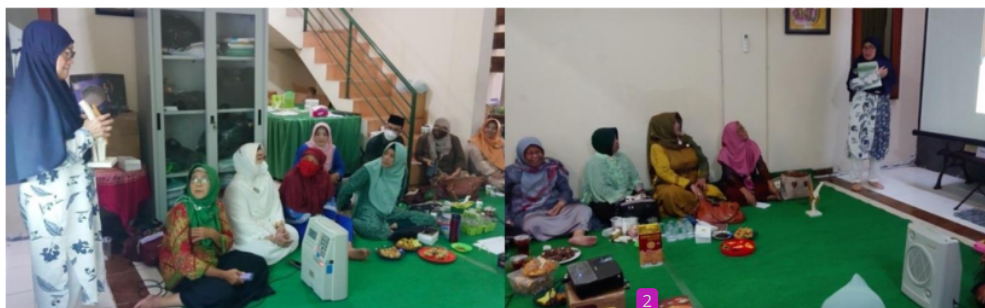
Gambar 1. Pemberian Edukasi Kesehatan Lutut dan Cara Mencegah Nyeri Lutut kepada Pengurus Wilayah Muslimat Nahdlatul Ulama Jawa Timur.

Kegiatan pengabdian kepada masyarakat ini dilaksanakan pada 24 Mei 2022 yang bertempat di Kantor PW Muslimat NU Jawa Timur (Gambar 1). Kegiatan diselenggarakan secara luar jaringan atau offline selama 90 menit. Kegiatan ini dihadiri oleh 30 peserta yang merupakan Pengurus Wilayah Muslimat NU Jawa Timur, berasal dari berbagai kabupaten yang tersebar di Jawa Timur. Semua peserta berjenis kelamin perempuan yang berusia dari 45 sampai 65 tahun. Peserta juga merupakan tokoh penting yang merupakan pengasuh dan pengurus Pondok Pesantren yang berada di Jawa Timur.