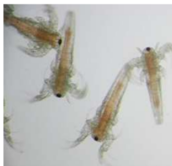
Gambar 3. Larva Artemia Salina

Berdasarkan tabel 3 dan 4 terlihat bahwa semakin tinggi konsentrasi maka semakin besar tingkat kematian larva A.Salina . Tingkat kematian dapat ditentukan secara langsung dengan membandingkan konsentrasi terendah hingga konsentrasi tertinggi. Hal ini dapat diartikan bahwa kematian larva A.Salina meningkat seiring dengan peningkatan konsentrasi dalam sampel. Gambar larva A.Salina yang digunakan dalam uji toksisitas metode BSLT dapat dilihat dalam gambar 3. (Runtuwene and Wewengkang 2016)