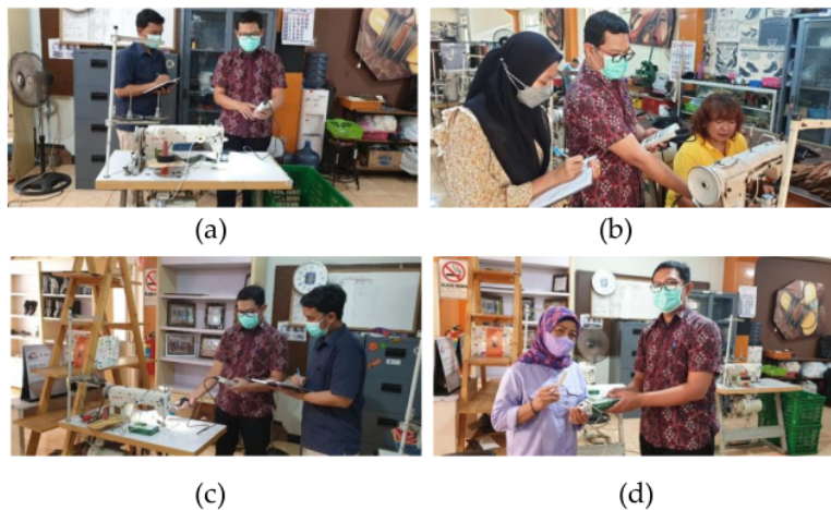
Gambar. 2 (a) pengukuran intensitas pencahayaan ; (b) pemasangan pecahaya local ; (c) pengukuran pencahayaan sesudah pemasangan local lighting; (d) penyerahan secara simbolis local lighting