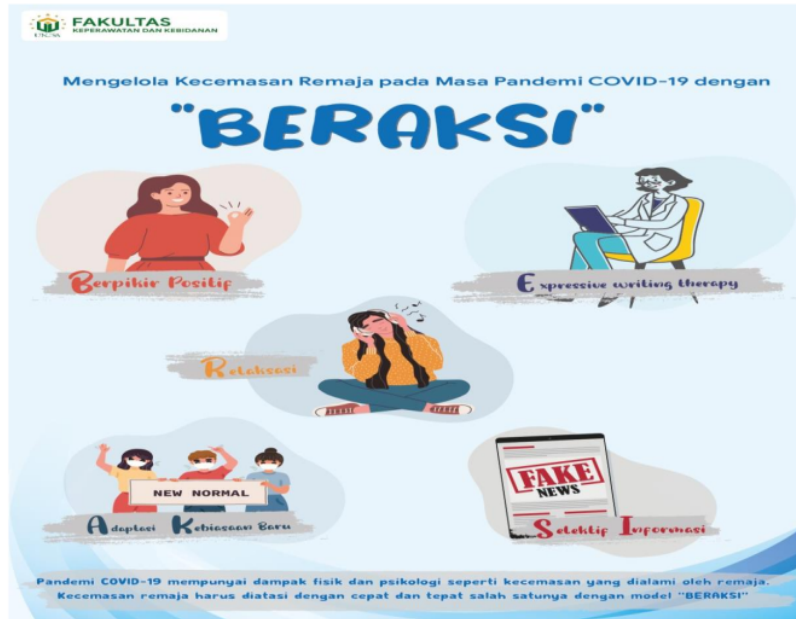
Gambar 1. Poster "BERAKSI"