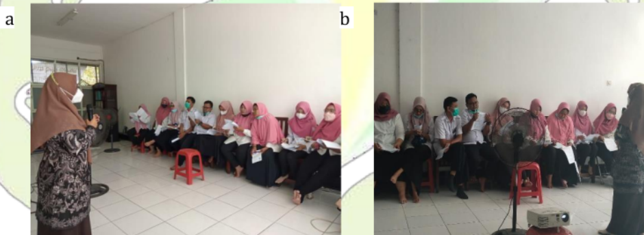
Gambar. 1 (a) pelaksanaan pretest ; (b) pelatihan caregiver

dukungan psikologis. Peran caregiver baik dikarenakan pemberi perawatan mengetahui benar tentang kebutuhan dasar pada lansia yang dirawat sehingga lansia dapat mencapai kualitas hidup di usia senjanya. Sehingga ketrampilan caregiver dalam menangani lansia dengan demensia sangat diperlukan. Peran caregiver antara lain memberi penilaian dasar yang mencakup komponen-komponen berikut: riwayat medis (seperti latar belakang medis dan obat-obatan saat ini); riwayat gejala; konsekuensi psikososial, sikap terhadap penyakit, efek pada kehidupan sehari-hari dan kualitas hidup pasien, pengalaman kerabat, mobilitas (transfer, berjalan, tingkat kesesuaian pakaian, penglihatan, kebersihan pribadi, toilet, fasilitas), keparahan gangguan kognitif, atau gangguan perilaku yang dapat mempengaruhi fisiologi tubuh dan kerja sama dengan bantuan toileting; pemeriksaan fisik dan hasil tes laboratorium (Lynn Chenoweth, Yun-Hee Jeon, Teri Merlyn, 2010).