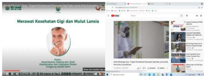
Gambar 4. Video Edukasi Terkait Kesehatan Gigi Anak dan Edukasi yang dilakukan Pada Youtube Chanel

Pandemi diawali pada Maret 2020, hal ini menyebabkan terjadinya pergeseran dari segala aktifitas offline menjadi aktifitas online, salah satu kegiatan adalah video edukasi kepada masyarakat (Apriani, Oktaviani, Wiwin A, 2020). Pembuatan video edukasi sangatlah penting digunakan untuk metode pembelajaran, secara visual dalam bentuk gambar yang bergerak mempermudah orang untuk lebih memahami media pembelajaran (Imany dkk., 2019) (Didiharyono & Qur'ani, 2019). Harapan dari pembuatan video edukasi ini nanti akan digunakan sebagai sara edukasi di media social dan kuliah whatsapp group (Azzahra, 2017). video edukasi merupakan hal yang sering kita jumpai, metode ini sangat cukup efektif dan efisien sebagai metode pembelajaran (Agustini , 2020) (Ariyanti dkk, 2020).