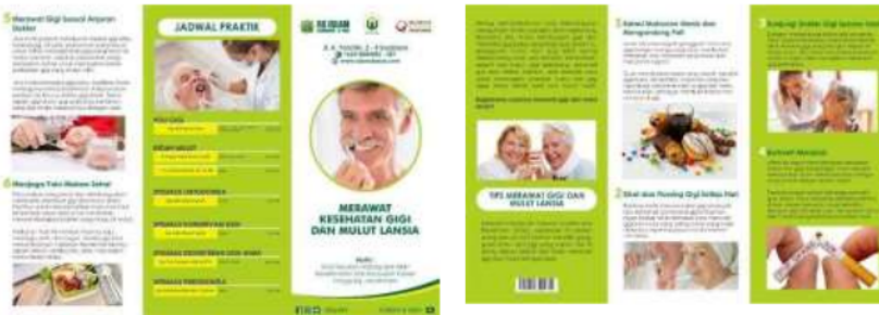
Gambar 1 Pembuatan Leaflet Kesehatan Gigi Lansia

Leaflet adalah media cetak yang berupa selebar kertas yang dicetak dengan menggunakan gambar yang menarik sehingga audience tertarik untuk membaca dan belajar dari apa yang disampaikan pesan melalui leaflet tersebut (Razi dkk., 2020). Sampai sekarang leaflet masih banyak digunakan dikarenakan kesederhanaan metode dan informasi yang diberikan cukup efektif dan efisien (Nubatonis, 2017). Metode leaflet dapat dipelajari dengan mandiri dan berulang sehingga mampu meningkatkan pengetahuan tentang suatu informasi (Meliyanti, 2015).