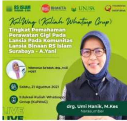
Gambar 2. Leaflet Promosi Kul WAG