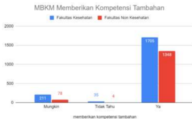
Gambar 4: MBKM memberikan Kompetensi Tambahan

Kebijakan MBKM memberi hak bagi mahasiswa untuk belajar selama 3 semester di luar program studi. Kebebasan ini tentunya akan memberikan kompetensi tambahan di luar kompetensi inti program studi masing-masing. Keterampilan dalam menyelesaikan permasalahan nyata yang kompleks, keterampilan dalam menganalisis, etika profesi, dan kompetensi di bidang lain di luar program studi sangat mungkin dapat diperoleh melalui implementasi MBKM (Direktorat Jenderal Pendidikan Tinggi Kemdikbud RI, 2020). Oleh karena itu, berdasarkan hasil penelitian diketahui bahwa sebagian besar mahasiswa berpendapat bahwa MBKM memberikan kompetensi tambahan bagi mahasiswa. Detail hasil dapat dilihat pada Gambar 4.