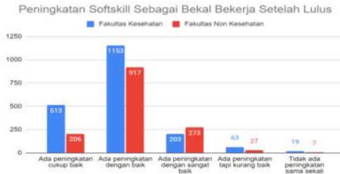
Gambar 6: Peningkatan Soft Skill Bekla Bekerja

peningkatan soft skill mulai dari cukup baik, sangat baik, kurang baik, dan tidak ada peningkatan sama sekali tersaji pada Gambar 6.