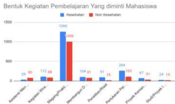
Gambar 3: Bentuk Kegiatan Pembelajaran Yang Diminati Mahasiswa