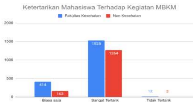
Gambar 2: Ketertarikan Mahasiswa Terhadap Kegiatan MBKM

Tidak jauh berbeda, pada Fakultas Non Kesehatan sebagian besar mahasiswa sangat tertarik terhadap program MBKM. sebesar 88,39 % mahasiswa berada pada tingkat sangat tertarik. Persentase mahasiswa yang memiliki ketertarikan biasa saja hanya sebesar 11,4 %. Angka ini hanya setengah dari persentase jumlah mahasiswa Fakultas Kesehatan dengan tingkat ketertarikan yang sama. Sementara itu, sebesar 0,21 % mahasiswa tidak tertarik terhadap program MBKM. Nilai ini juga lebih kecil dibandingkan persentase mahasiswa Fakultas Kesehatan yang tidak tertarik terhadap program MBKM.