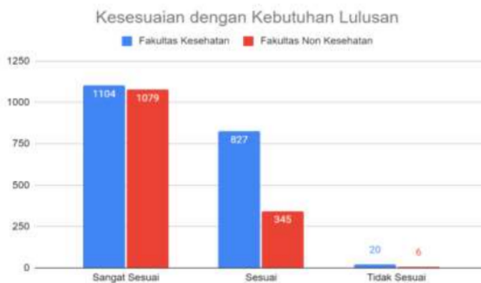
Gambar 5: Kesesuaian dengan Kebutuhan Lulusan

Salah satu tujuan implementasi program MBKM adalah menyiapkan lulusan sebagai pemimpin masa depan bangsa yang unggul dan berkepribadian. Keterampilan yang diperoleh mahasiswa selama perkuliahan, baik di dalam prodi maupun di luar prodi melalui MBKM sebagai bekal di masa mendatang. Hasil penelitian ini menunjukkan bahwa sebesar 56,59 % dan 42,39 % mahasiswa Fakultas Kesehatan berpendapat bahwa sangat program MBKM sangat sesuai dan sesuai dengan kebutuhan lulusan di masa mendatang. Pendapat yang sama dengan persentase berbeda disampaikan oleh mahasiswa Fakultas Non Kesehatan. Sebesar 75,45 % dan 24,13 % mahasiswa menyatakan bahwa program MBKM sangat sesuai dan sesuai untuk kebutuhan lulusan. Hasil ini semakin memberikan bukti bahwa program MBKM memberikan dampak positif untuk mempersiapkan lulusan dalam memenuhi kebutuhan di masa mendatang. Berdasarkan Gambar 5, diketahui bahwa hanya terdapat 1,03 % dan 0,42 % dari masing-masing mahasiswa fakultas kesehatan dan non kesehatan yang menyatakan ketidaksesuaian program MBKM dengan kebutuhan lulusan.