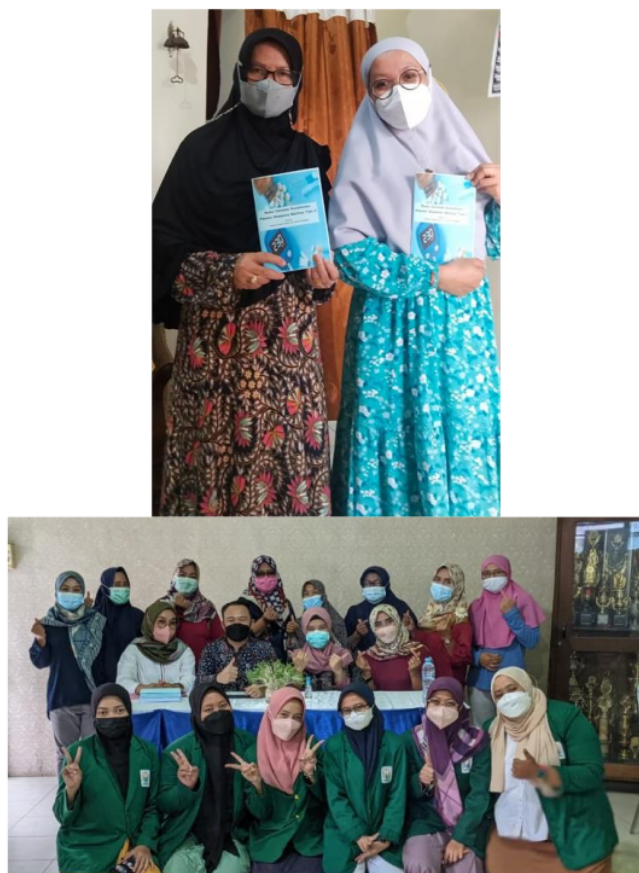
Gambar 2. Suasana pertemuan offline (a)Pembukaan (b) Konsultasi Kesehatan (c) Pembagian Buku (d) Sebagian peserta Tahap Offline

Hasil pemeriksaan gula darah yang diperoleh saat tahap offline adalah sebagian besar menunjukkan hasil kadar gula darah di atas 200 mg/ dL, seperti tampak pada tabel 1 berikut ini.