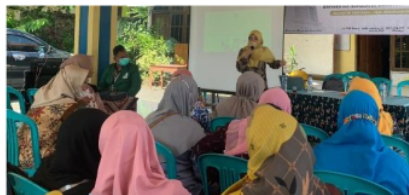
Gambar 1. Penyampain sosialisasi dan pelatihan

Pada tahap ini, kegiatan dimulai dengan sosialisasi mengenai manfaat teknologi fermentasi madu bawang putih tunggal (lanang). Kegiatan ini dilakukan bertujuan untuk memberikan wawasan dan pemahaman tentang penggunaan obat herbal yang aman untuk menurunkan angka penderita penyakit kolesterol di Desa Wedoroanom. Selain itu, pada kegiatan ini tim pengabdian memberikan wawasan tentang khasiat madu dan bawang putih tunggal serta manfaat ketika kedua bahan tersebut diolah dalam bentuk fermentasi madu-bawang putih tunggal.