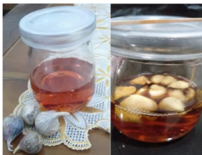
Gambar 2. Fermentasi madu-bawang putih tunggal

Kegiatan ini dilanjutkan dengan kegiatan pelatihan untuk mengimplementasikan teknologi fermentasi pada madu menggunakan bawang putih tunggal (lanang). Kegiatan pelatihan ini dilakukan bertujuan untuk memberikan bekal bagi masyarakat agar dapat mengaplikasikan teknik pembuatan fermentasi madu-bawang putih tunggal secara mandiri sehingga akan mengurangi angka kejadian kolesterol di Desa Wedoroanom, Gresik. Selain itu, peserta pelatihan yang terdiri dari kader kesehatan dapat memberikan ilmu yang dimiliki selama pelatihan kepada seluruh masyarakat melalui kegiatan pelayanan kesehatan.