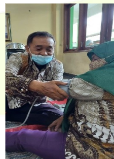
Gambar. 1 (a) Demonstrasi tindakan; (b) Pelatihan