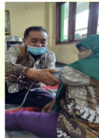
Gambar. 1 (a) Demontrasi tindakan; (b) Pelatihan