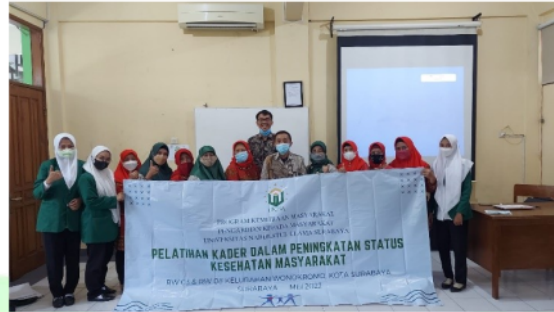
Gambar. 1 (c) Penutupan Kegiatan Pelatihan Kader

pada gambar b adalah dokumentasi pelaksanaan pelatihan mandiri salah satu kader dalam pemeriksaan kesehatan.