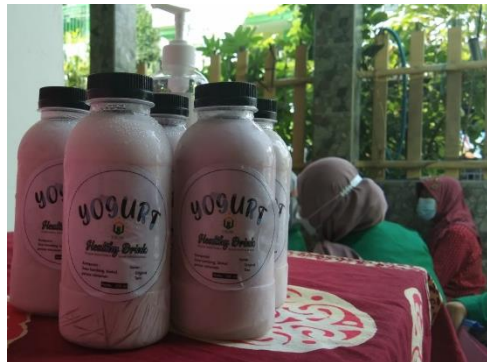
Gambar 3. Produk Yogurt Susu Kambing

Produk yang dihasilkan dari kegiatan pengabdian kepada masyarakat ini yaitu yogurt susu kambing yang merupakan pangan fungsional berupa minuman probiotik yang memberikan banyak manfaat bagi kesehatan.