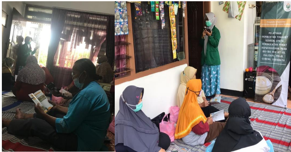
Gambar 2. Edukasi Pembuatan Yogurt

Produk yang dihasilkan dari kegiatan pengabdian kepada masyarakat ini yaitu yogurt susu kambing yang merupakan pangan fungsional berupa minuman probiotik yang memberikan banyak manfaat bagi kesehatan.