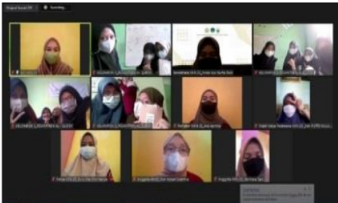
Gambar 1. Pemaparan materi edukasi pencegahan penularan Covid-19

Hasil pengabdian kepada masyarakat adalah tercapainya pembuatan produk jelly drink kunyit asam untuk menjaga imunitas, tercapainya pembagian stater kit berupa vitamin C, masker medis dan kain, hand sanitizer untuk anak santri dan pemaparan beberapa materi edukasi kepada santri putri sehingga diharapkan dapat menjadi kader santri tanggap Covid-19 dan menjadi agen perubahan yang meneruskan informasi yang sudah diperoleh ke santri lain di Pondok pesantren Al Qudsy, Candi, Sidoarjo. Hasil capaian adalah jumlah sasaran yang sesuai target yaitu mendapatkan produk jelly drink kunyit asam yang pembuatannya telah di praktekan bersama, mendapatkan stater kit berupa suplemen vitamin C, masker medis dan kain, hand sanitizer serta edukasi tentang pencegahan penularan Covid-19 di Pondok Pesantren Al Qudsy, Candi, Sidoarjo.