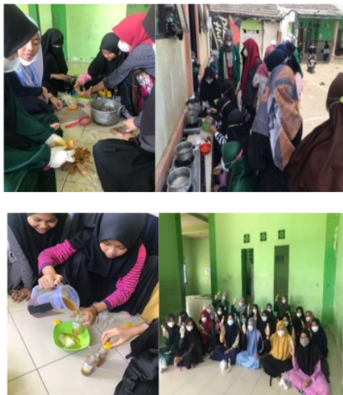
Gambar 2. Pembuatan produk jelly drink kunyit asam

Tim pengabdian kepada masyarakat membuat program pemaparan edukasi pencegahan penularan Covid-19 agar santri putri pondok Al Qudsy dapat mengetahui tentang pentingnya pencegahan dan penularan Covid-19. Hal ini berdasarkan bukti yang tersedia bahwa Covid-19 ditularkan melalui kontak erat, bukan melalui transisi udara. Orang yang paling beresiko terinfeksi adalah mereka yang berhubungan dekat dengan pasien Covid-19 atau yang merawat pasien Covid-19. Berdasarkan hasil analisis kuesioner pre-posttest yang diberikan, diketahui terdapat peningkatan pengetahuan santri terhadap materi yang diberikan yaitu pencegahan penularan covid-19. Skor rerata sebelum diberikan edukasi yaitu sebesar 71,6 dan setelah diberikan edukasi meningkat menjadi 91,1. Media edukasi yang digunakan yaitu video.